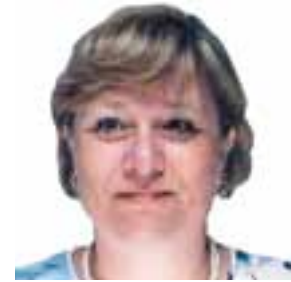
Доктор Маргарет Педен

Для получения дополнительной информации о программе «Сотрудничество в рамках ООН в области безопасности дорожного движения» используйте сайт: http://www.who.int/roadsafety/en/index.html